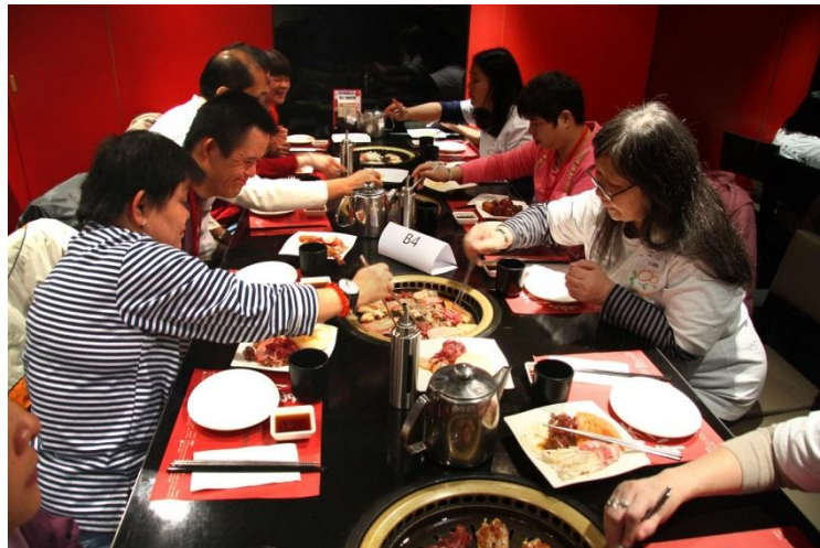
企业义工细心地指导智障人士如何分辨生熟食物。