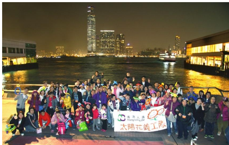
参加者于维港岸边来一个温馨大合照。