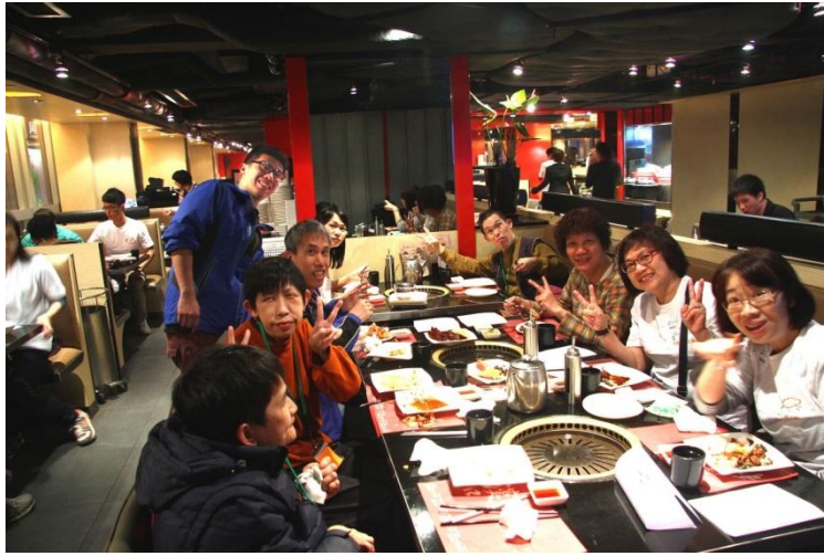
企业义工及智障人士齐集于韩国料理餐厅，他们显得十分兴奋。