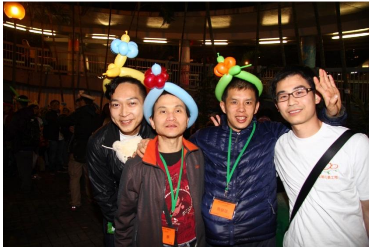
企业义工及智障人士相处融洽，短时间内打破了隔膜。